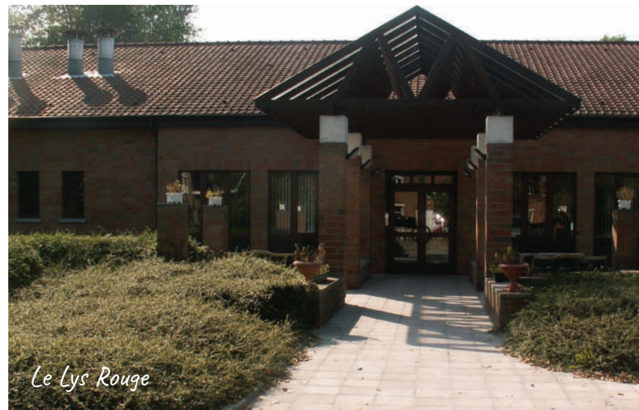
Le Lys Rouge